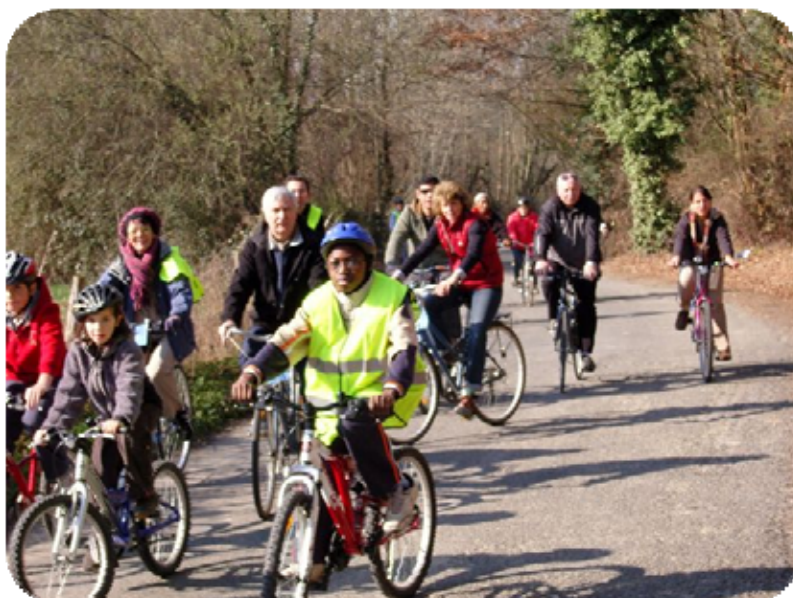
Dimanche 17 février 2008 : l'équipe « ...et si Lons changeait d'ère ? » a commencé le travail de recensement des endroits dangereux pour les cyclistes à Lons.