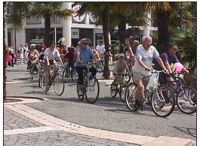
Fête du Vélo 2003, départ du circuit-découverte (Place d'Espagne le 31 mai)